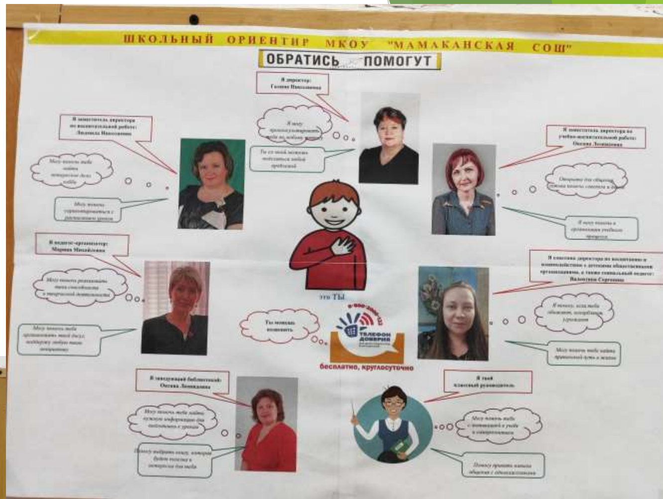
Стенд «Травли NET»